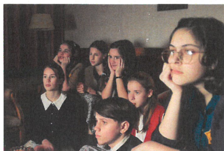
Scène uit het videodagboek.

26-10-41 Verbod op alle Joodse tijdschriften.