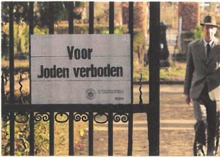
Scène uit het videodagboek. Bordje Voor Joden verboden bij de ingang van een park.