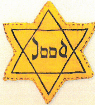
Vanaf mei 1942 moeten alle Joden in Nederland ouder dan zes jaar een jodenster dragen.